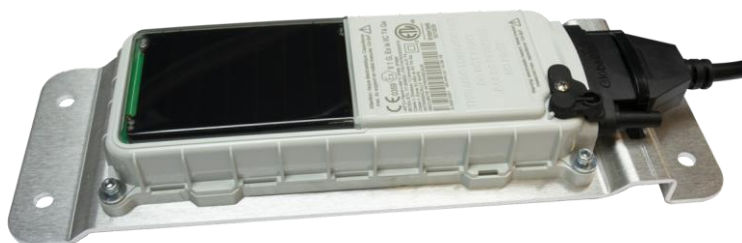
Geoforce ERT Kit